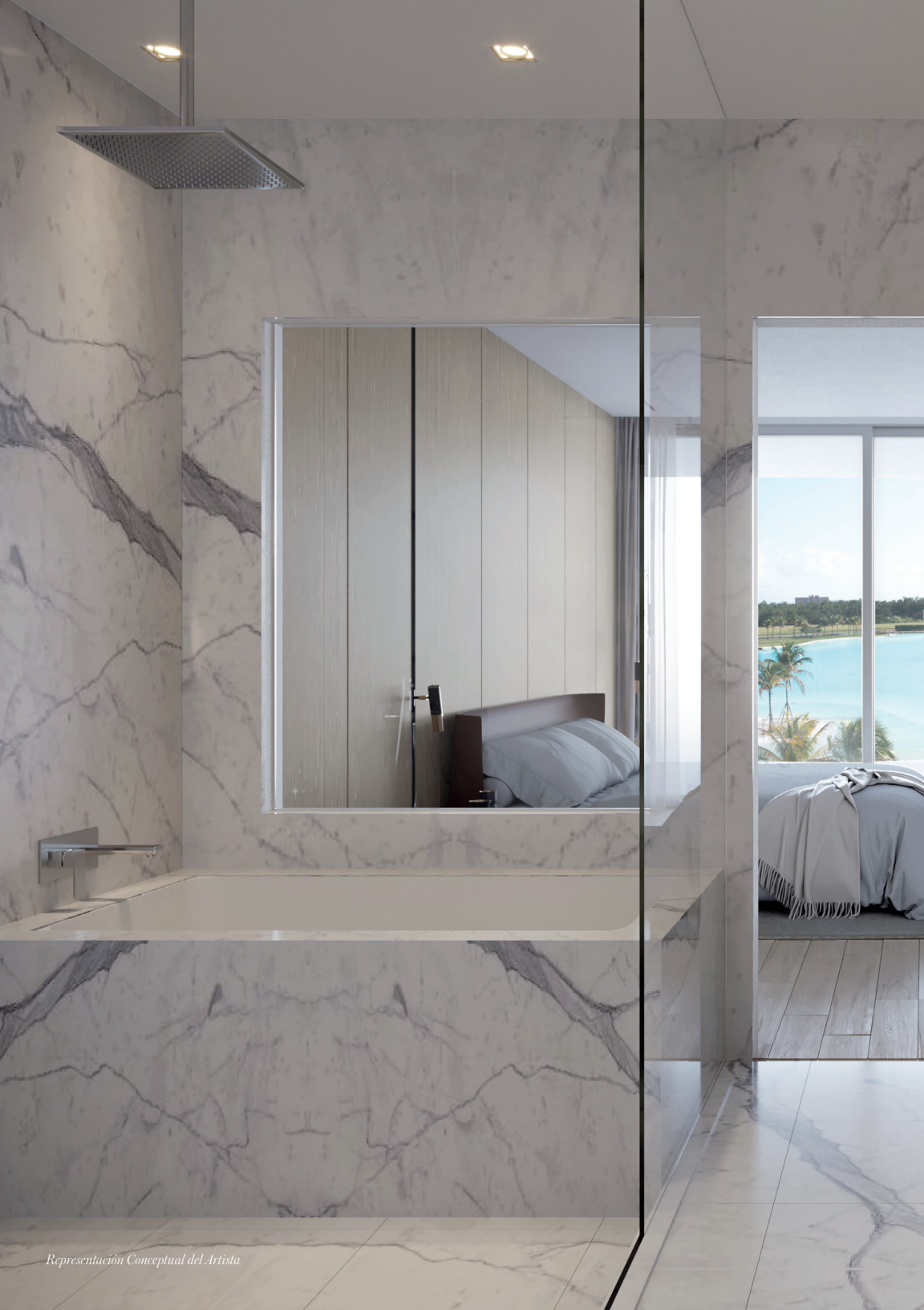
Representación Conceptual del Artista