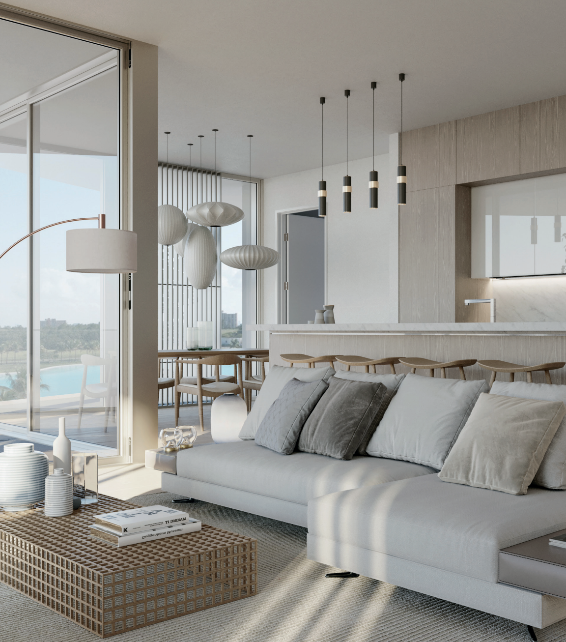
Representación Conceptual del Artista