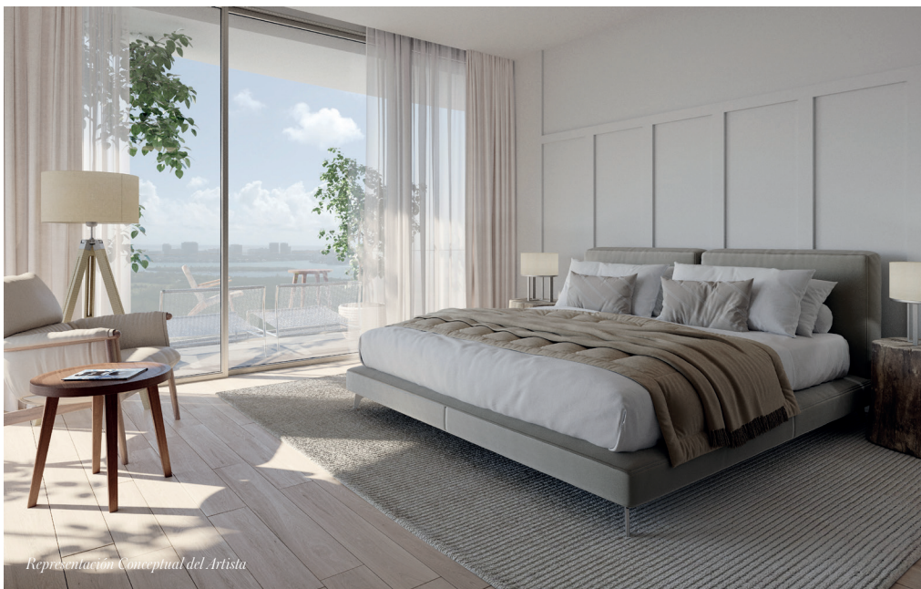
Representación Conceptual del Artista

Las paredes con ventanas del piso al techo permiten abundante luz natural en todas partes, iluminando los interiores de los condominios de Meyer Davis Studio con acabados de diseñador en una paleta suave y neutra.