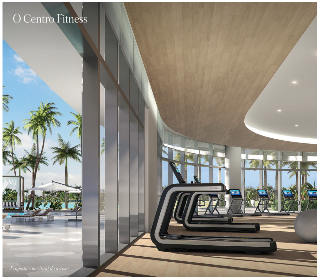
O Centro Fitness