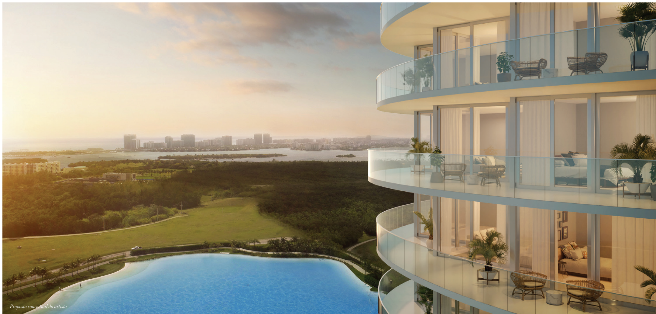
Proposta conceitual do artista