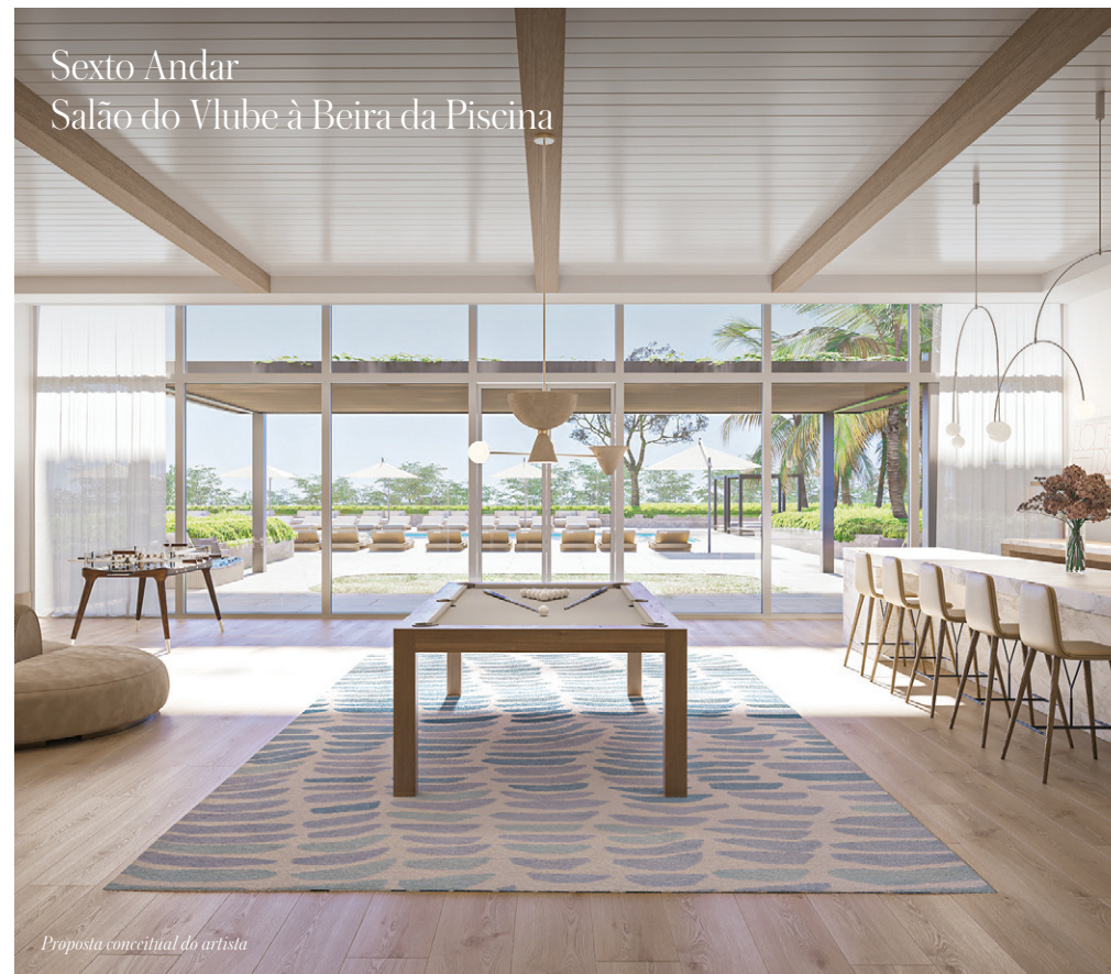
Sexto Andar Salão do Clube à Beira da Piscina