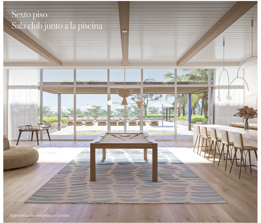
Sexto piso Sala club junto a la piscina